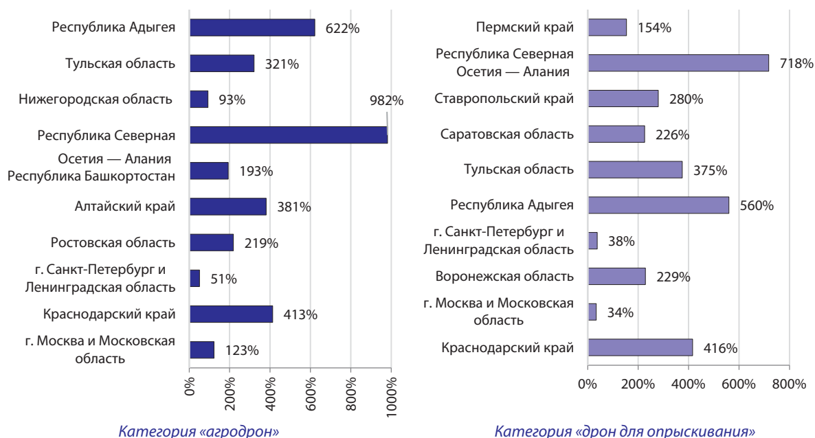
Рис. 3. Региональная популярность поисковых запросов потребителей по категориям «агродрон» и «дрон для опрыскивания» в регионах Российской Федерации