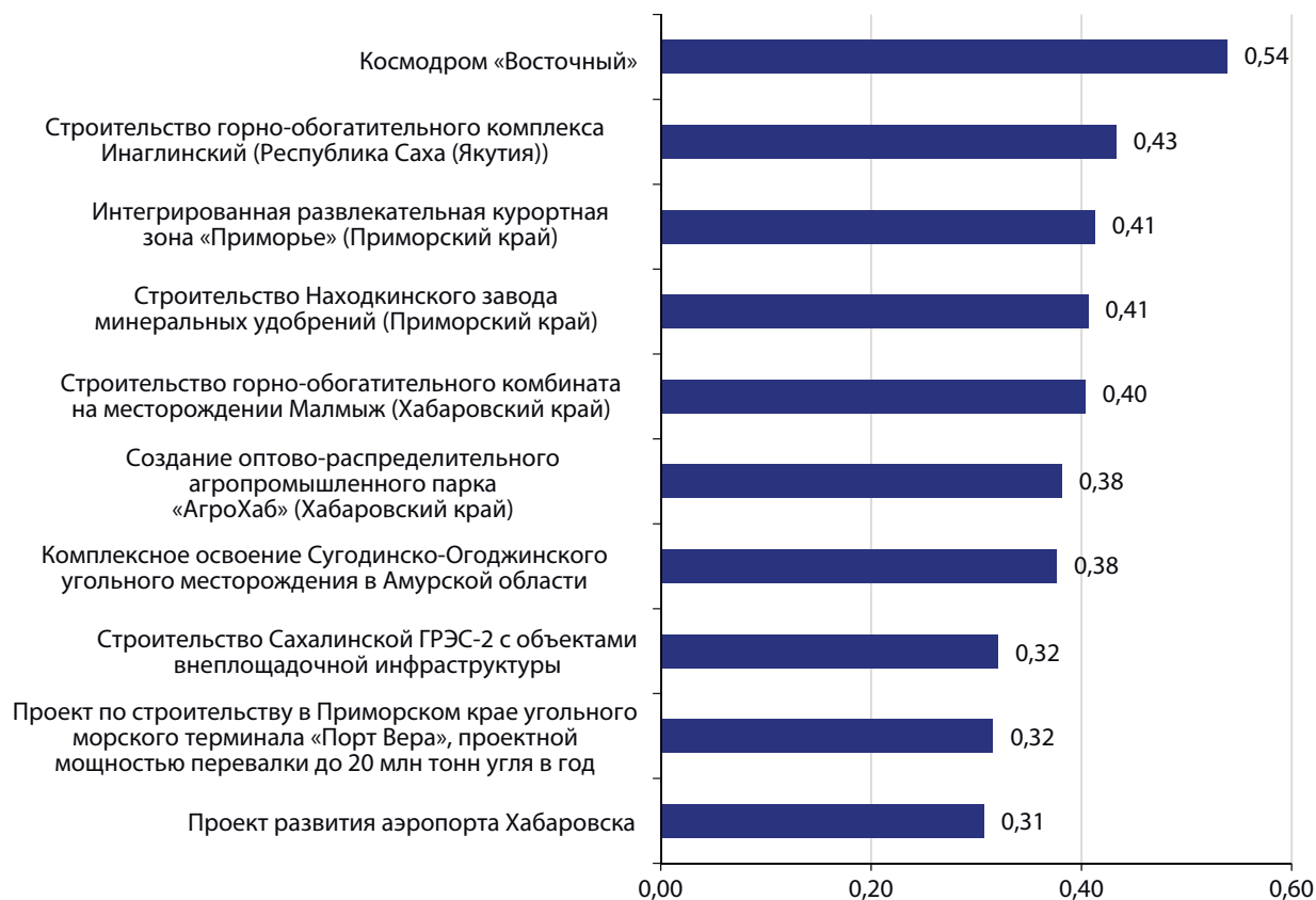
Рис. 6. Ранжирование инвестиционных проектов ДФО по региональной эффективности