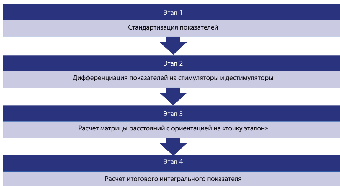
Рис. 5. Алгоритм расчета интегрального показателя влияния РИП на региональное развитие