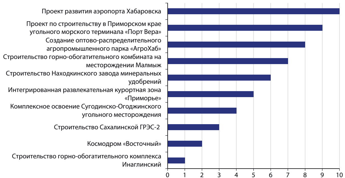
Рис. 8. Рейтинг инвестиционных проектов по оценке совокупного мультипликативного влияния на социально-экономическое развитие регионов (примечание: *место проекта в рейтинге)