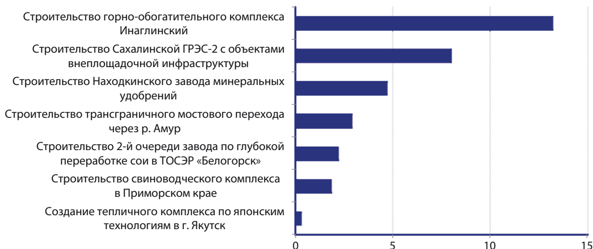
Рис. 3. Рейтинг инвестиционных проектов Дальнего Востока по ожидаемой бюджетной эффективности, млрд руб. (источник: Фонд развития Дальнего Востока. Инвестиционные проекты. URL: https://www.fondvostok.ru/projects/investment_projects/ (дата обращения: 20.08.2021))