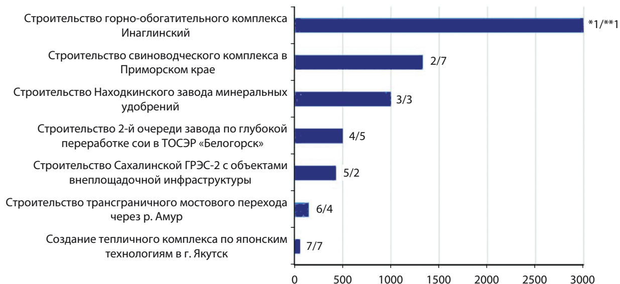
Рис. 4. Рейтинг инвестиционных проектов Дальнего Востока по ожидаемой социальной эффективности, млрд руб. (источник: Фонд развития Дальнего Востока. Инвестиционные проекты. URL: /investment_projects/ (дата обращения: 20.08.2021)) (примечание: *место проекта в рейтинге бюджетной эффективности / **место проекта в рейтинге социальной эффективности)