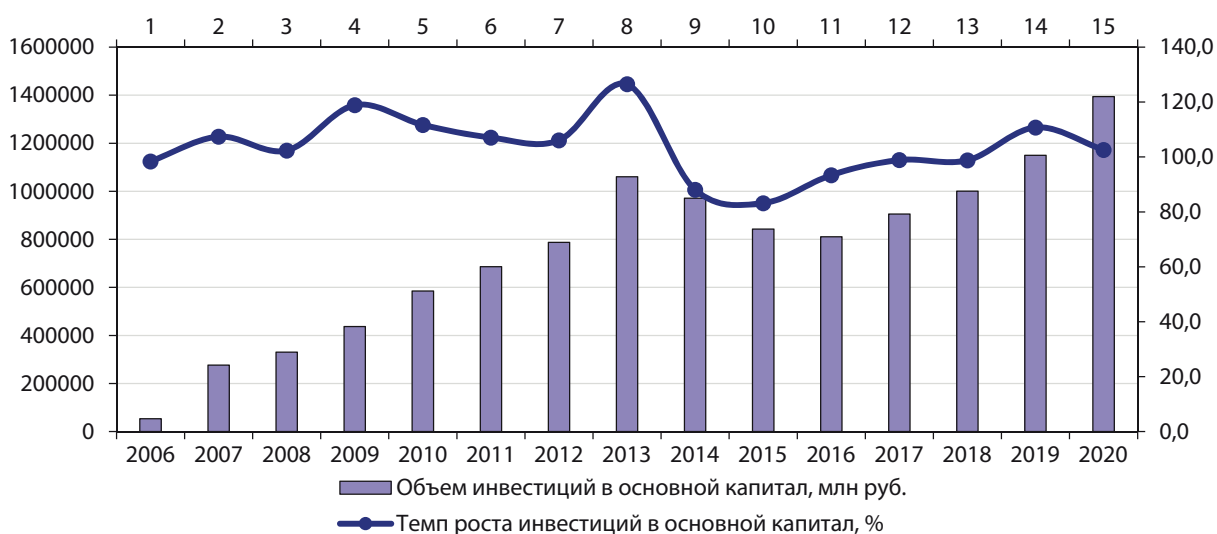
Рис. 2. Сопоставление динамики объемов и темпов роста инвестиций в Дальневосточном федеральном округе Fig. 2. Comparison of dynamics of investment volumes and growth rates in the Far Eastern Federal District

ций в период посткризисных процессов в экономике 2010–2011 гг. Дальневосточный федеральный округ как специфичная территория, обладающая значительным количеством особых экономических зон с преференционными условиями для инвесторов, также отреагировал на посткризисные явления в экономике, но гораздо большую просадку данный показатель получил в период 2015–2017 гг., что связано с уходом из регионов ДФО крупных инвесторов (рис. 1, 2).